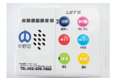
▲録音可能時間は最大60分

申込み 電話で、生活・交通安全係へ ☆無くなり次第終了。受け取りは区役所8階15番窓口で。非常通報装置を接続している電話機など、設置できない場合あり。詳しくは、同係へ問い合わせを